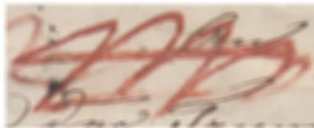
Obr. 1 Písaný znak NB používaný pre označenie doporučených zásielky prevažne v profanárskom období

Predpisy pre označovanie doporučených listov boli stanovené v Rakúsko-Uhorsku (ďalej len RU) už v deväťdesiatych rokoch 18. storočia (Votoček [1]). Podľa týchto dobových predpisov mal byť každý doporučený list označený číslom, zhodným s číslom podacieho lístka a aj vhodným a dobre viditeľným označením svojej dôležitosti. Preto sa doporučené listy označovali poznámkou NB (z latinčiny Nota Bene - dobre poznamenaj), a to obyčajne červenou alebo hnedou hrudkou, neskôr tmavým atramentom. V priebehu doby sa táto skratka zmenila na písaný znak, tvorený radou zvislých alebo šikmých čiarok, preškrtnutých jednou alebo niekoľkými vodorovnými čiarami.