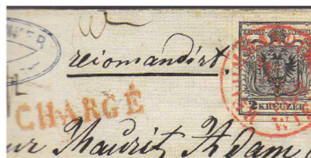
Obr. 3 Výrez z listu do Paríža z roku 1858 s červenou pečiatkou CHARGÉ

Pre úplnosť treba doplniť, že pomocné pečiatky mali napríklad ľahku červenu, modrú či žltú. Na obr. 3 je ukážka časti dopravného listu do Paríža s pečiatkou CHARGÉ v červenej farbe (Ferchenbauer [3]). Týmto spôsobom boli označované doporučené zásielky pri prechode cez franciecke hranice v období platnosti I. a II. vydania výplatných známok RL.