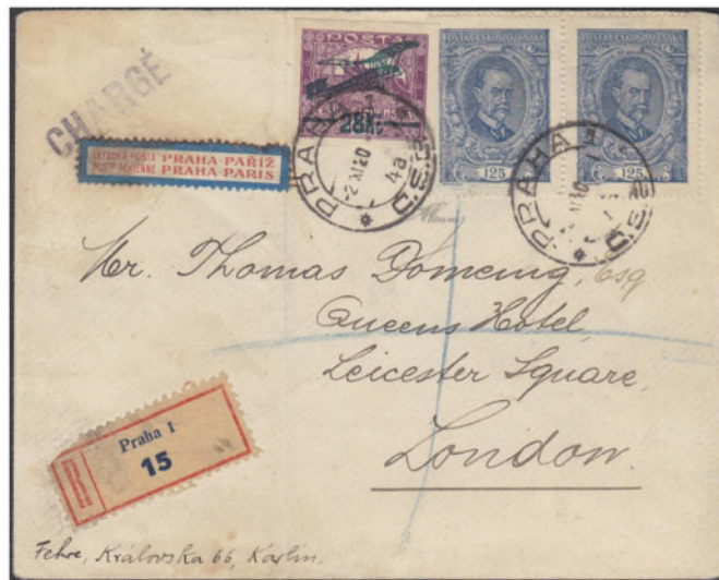
Obr. 5 Dopravný letecký list z roku 1920 do Londýna s pečiatkou CHARGÉ

Do tejto skupiny patrí aj letecký list z obr. 5. Základný poplatok za list do zahraničia o váhe do 20 gramov a doporučený príplatok do zahraničia boli uhradené dvojpáskou 125 h z emisie „TGM 1920“ so spojenými typmi. Letecký príplatok za leteckú dopravu do Londýna bol uhradený leteckou známkou v hodnote 28Kč z I. pre tlačovej emisie našich leteckých známok.