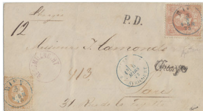
Obr. 4 Dopravný list z roku 1873, zasielajú do Paríža s pečiatkami RECOMMANDIRT a Chargé

Na obr. 4 je zobrazený doporučený list, odoslaný z Viedne do Paríža dňa 3. 3. 1873. Presne uhradené poštovné zodpovedá základnému poplatku vo výške 50 kr za ťažší list do 20 gramov (2x25 kr) a rekomandačnému príplatku 21 kr, ktorý je čiastočne uhradený na prednej strane listu známkou 15 kr. Zvyšná časť príplatku bola uhradená na zadnej časti celistvosti dvoma známkami 3 kr. Známkami boli znehodnotené dennou pečiatkou Viedne v modrej farbe.